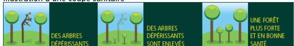
Illustration d'une coupe sanitaire

Les travaux débuteront au début du mois de novembre